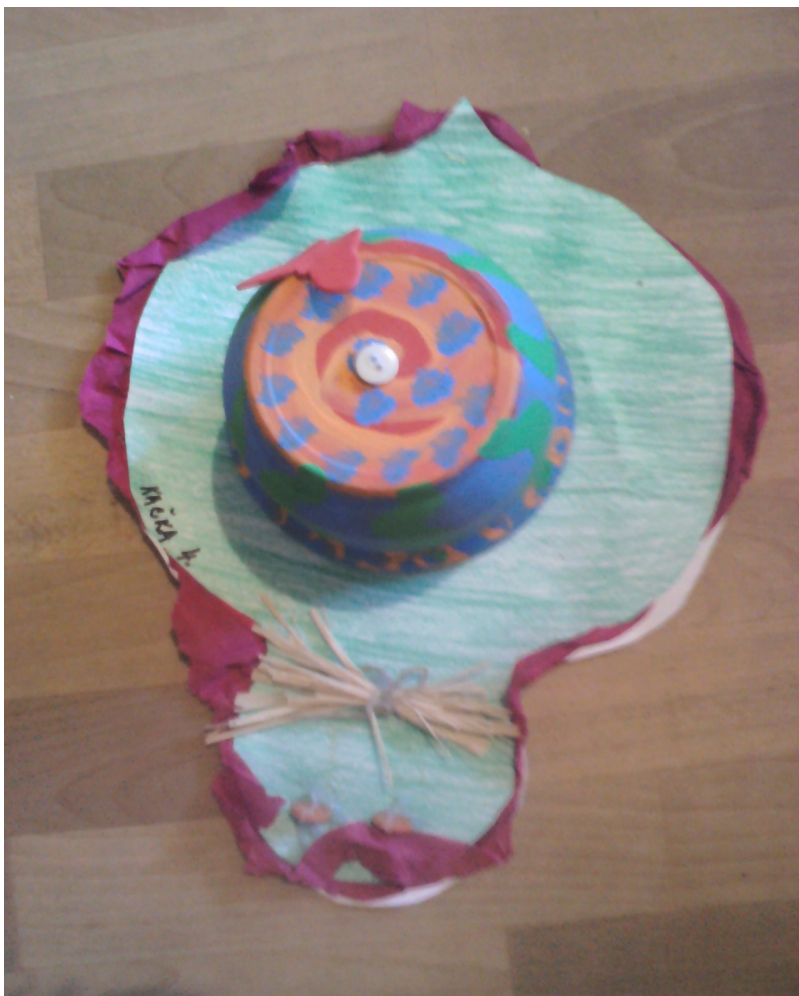
Malý šneci v trávě s kytičkami